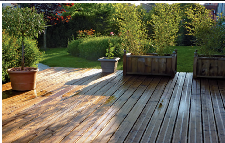
> TERRASSE BOIS