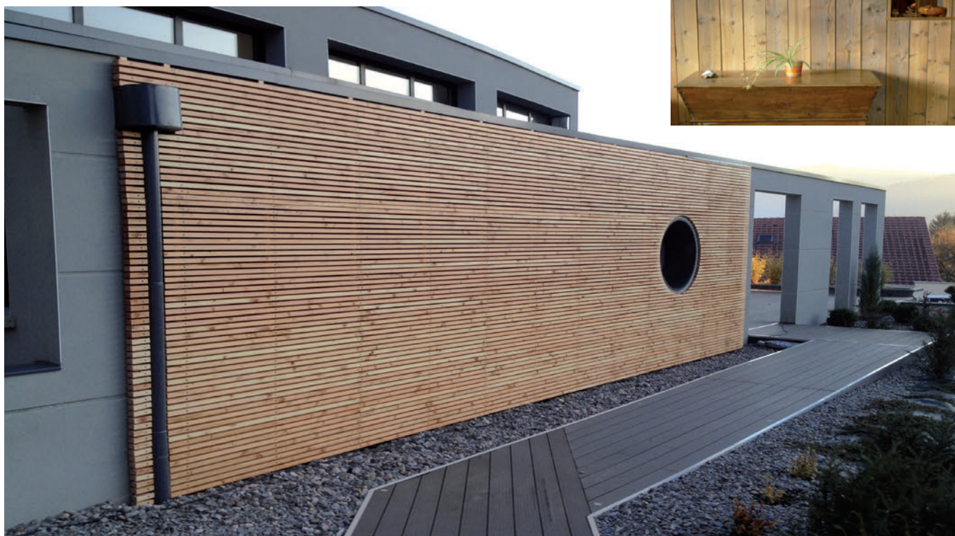
> BARDAGE BOIS